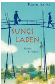
Karin Kalisa Sungs Laden München 2017

Wer würde hinter diesem unspektakulären Titel ein wunderbar amüsantes, trauriges, tragisches, hoffnungsvolles Buch über die Macht des Puppenspiels vermuten? Ich jedenfalls hätte es dem Titel und auch dem Cover nach, unter diesem Aspekt ganz sicher nicht gekauft. Und hätte